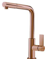
Monomando Omega Plus Copper 8498 858