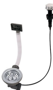
Desagüe automático 8407 100