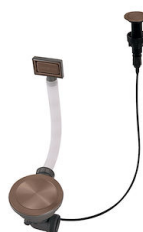
Desagüe automático Space Push Copper 8407 122