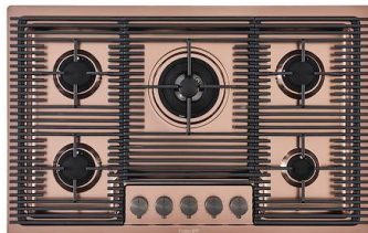
Placa de cocción Milanello Copper 5F 7682 008