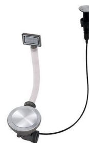
Desagüe automático Space Push - PP 8407 116