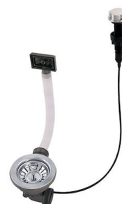
Desagüe automático 8407 000