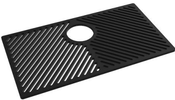
Rejilla Black 8100 653