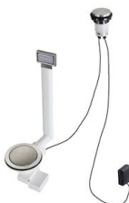
Desagüe automático Space Light - PL 8407 117